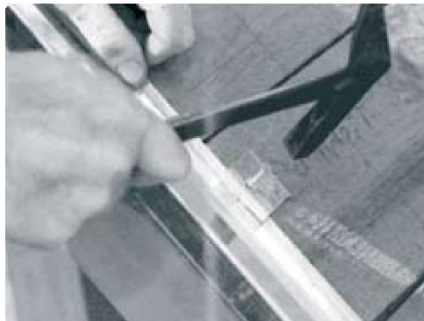
Befestigung mit Haften

TIPP: Überdeckung des Ober- und Unterteils höhenversetzt montieren. Dazu wird ein Unterteil pro Ortgangseite mittig mit einer Blechschere geteilt, um so mit einem 1m Stück traufseitig zu beginnen.